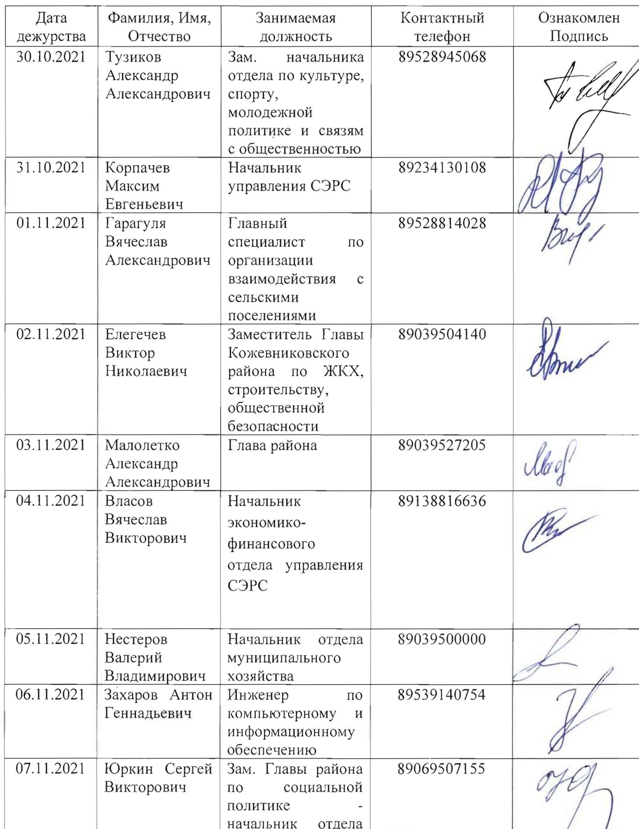
График дежурств ответственных должностных лиц муниципального образования «Кожевниковский район» в период выходных и праздничных дней с 30.10.2021 по 08.11.2021